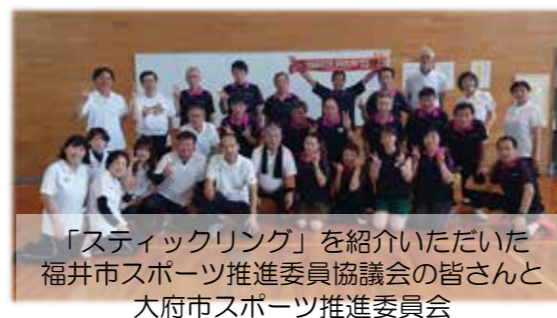
「スティックリング」を紹介いただいた 福井市スポーツ推進委員協議会の皆さんと 大府市スポーツ推進委員会