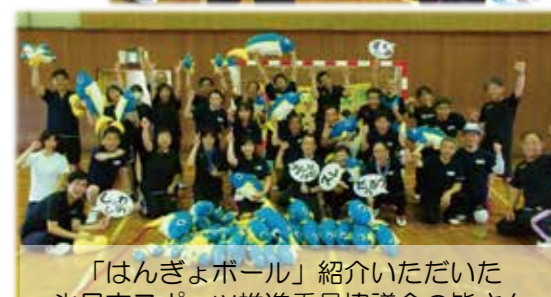
「ハンギョボール」を紹介いただいた 氷見市スポーツ推進委員協議会の皆さん と大府市スポーツ推進委員会