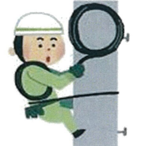
ライフライン復旧

○ライフライン機能が回復して自宅へ戻ったり、仮設住宅への入居が決まるなどして避難所を閉鎖する時期