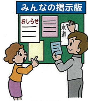
避難所内の 情報共有