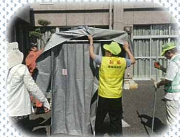
仮設トイレの設置